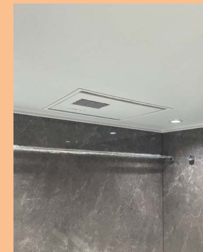
〈写真の説明〉 光により素晴らしい雰囲気を演出。楽湯と併せてリラックスできる浴室になりました。