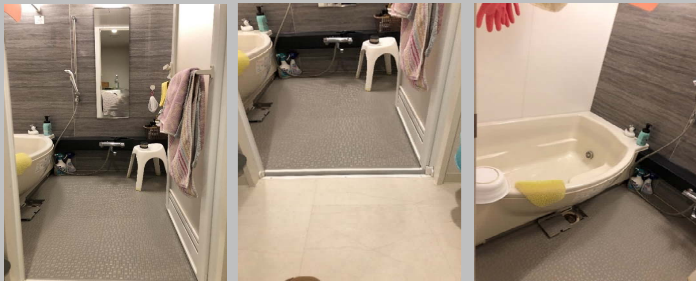
〈写真の説明〉 新築時は、色やデザインを選択する事が出来ない事が多いですね。