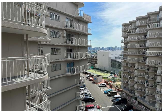
〈ベランダからの写真〉