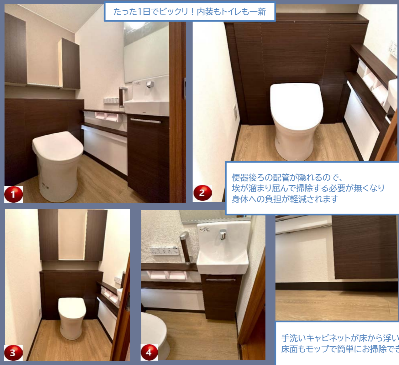
たった1日でビックリ！内装もトイレも一新