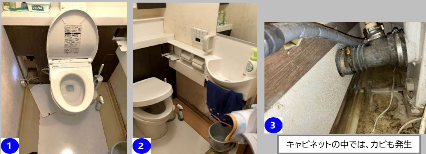
3 キャビネットの中では、カビも発生

〈写真の説明〉 前回他社で行ったリフォームで接続不良があり、カビが発生していました。